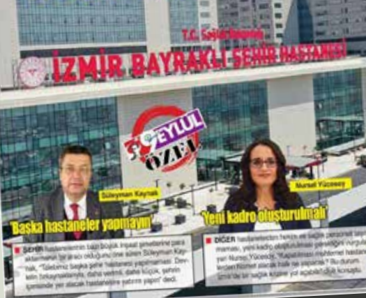
Başka hastaneler yapıyorlar Yeni kadro oluşturulmalı